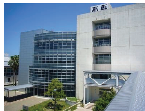
▲総合研究棟（左）と電子情報工学科棟 General Research Building(left), Electronics and Information Engineering Faculty Building

There are lounges at the connections with the Electronics and Information Engineering Faculty Building. The lounge, a common facility provided with a mini-kitchen, offers a space for the students to relax at recess. The frames are equipped with the low-yield-point hysteretic steel dampers for seismic response control and the 3rd and 4th floors have suspension structure. Moreover, the utilization of the cold heat storage in underground and photovoltaic power generation system installed on the building serve as supplementary energy for room air conditioners.