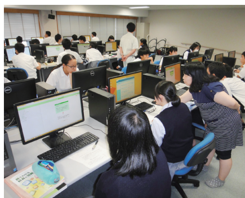
▲低学年の情報リテラシーの授業 Class of Information Literacy for the Lower Grades