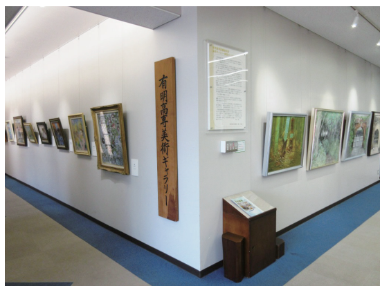
▲美術ギャラリー Art Gallery