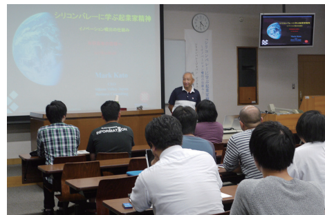
▲特別講演「シリコンバレーに学ぶ起業家精神」

The Regional Collaboration Center was founded for the purpose of activating the community through our college's active collaboration with local industries and local governments. It also aims at performing the functions of education, research, and development in basic technology for manufacturing products as well as holding consultations with small businesses in the areas concerning technological problems and conducting joint research. Moreover, this center plans and manages extension lectures for area children and adults.