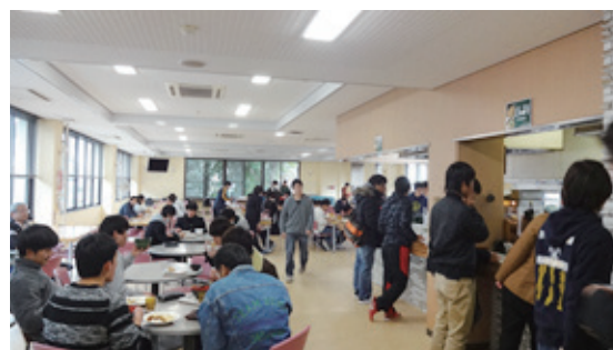
▲食 堂 Cafeteria