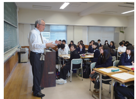
▲1年生に対する進路セミナー Career Seminar for 1st Year Students

Career Support Office (CSO) was established in order to make plans and promote activities to help the students choose better future career. Our activities are expected to contribute to forming their view of career useful to them not only on graduation, but continue to be helpful even at later stages of life. As the initial event, career seminars are being planned.