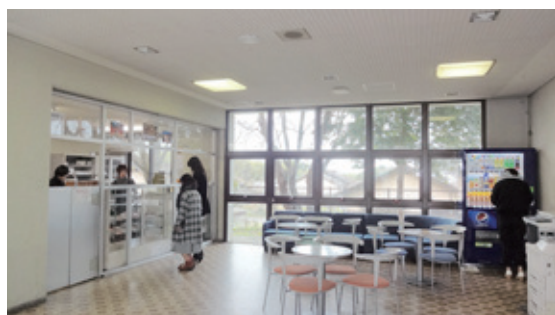
▲売 店 School Store

The Shuko-Kan was built in 1983 as welfare facility for the students. The two-story building with a floor space of 888m 2 includes a cafeteria, a health room, a counseling room, and a school store on the first floor. It also houses various students, service rooms on the second floor; a music room, and a room for the student council.