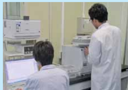
▲環境生命の実験の様子

Experiments of Life and Environmental Science Course