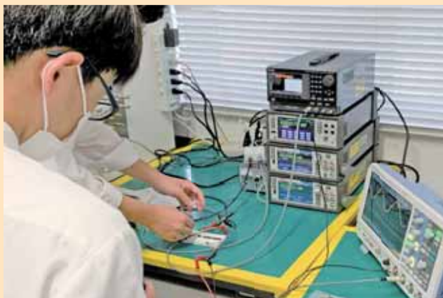
▲電子工学実験 Experiments in Electronic Circuits