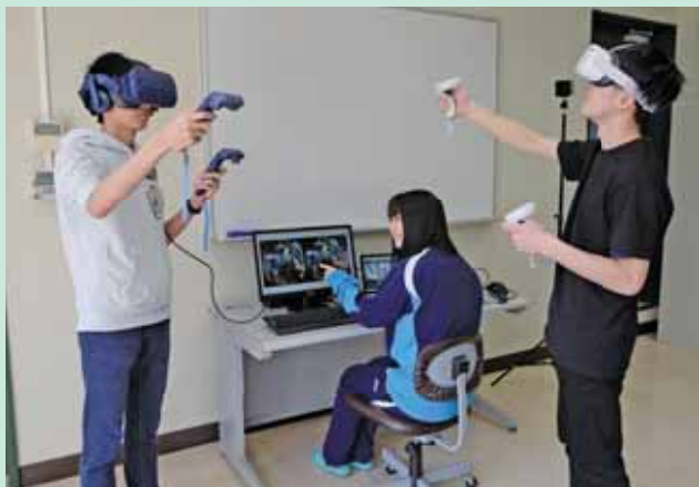
▲VR (仮想現実) の研究 Research of Virtual Reality