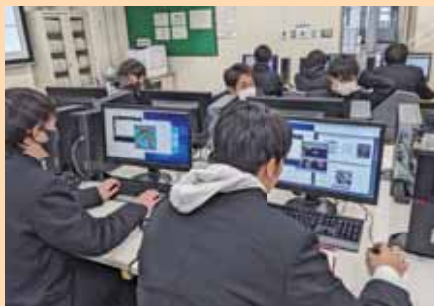
▲課題研究 II Exercises on Engineering II