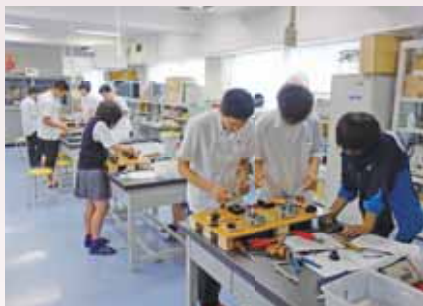
▲電気工事士実習 Electrician Practice