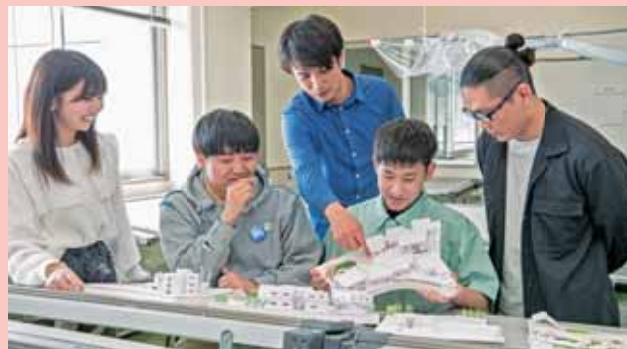
▲卒業設計 Graduation Design

建築は、衣食住という人間の基本的な生活の一つである「住」に直接的に関わり、人間に密接な存在で、都市や環境を構成する基本的な要素です。したがって、建築技術者は、人間の社会生活を育む自然や風土に調和した豊かな美しい生活空間を創造し、自然と共生しながら人間生活の安全性や快適性を追求し、人間生活の質を向上させなければなりません。さらに、都市問題、環境問題、加速度的に進行している高齢化社会にも建築技術者は対応し、貢献しなければなりません。そして、近年の想像を超えた自然災害に対しても人間の生命を守る使命を果たさなければなりません。そのため、建築学の知識とその領域を超えて機械工学や情報工学など、他の分野の知識を活用しながら、そのことに取り組んでいかなければなりません。