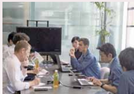
▲インターンシッププログラム Internship Program