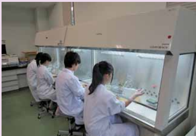
▲クリーンベンチによる無菌操作 Asepsis on Clean Bench