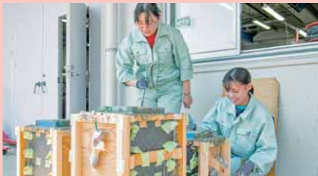
▲卒業研究 Graduation Research