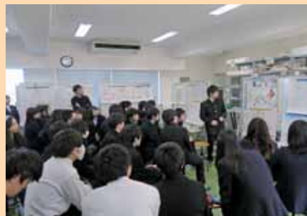
▲建築設計演習 Architectural Design and Drawing

人間・福祉工学系は、人間を対象とし、人々の生活の質の向上を目指して都市問題、高齢化社会問題などの諸課題に取り組む技術者を育成することを目的としています。