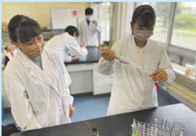
▲応用化学の実験の様子 Experiments on Applied Chemistry