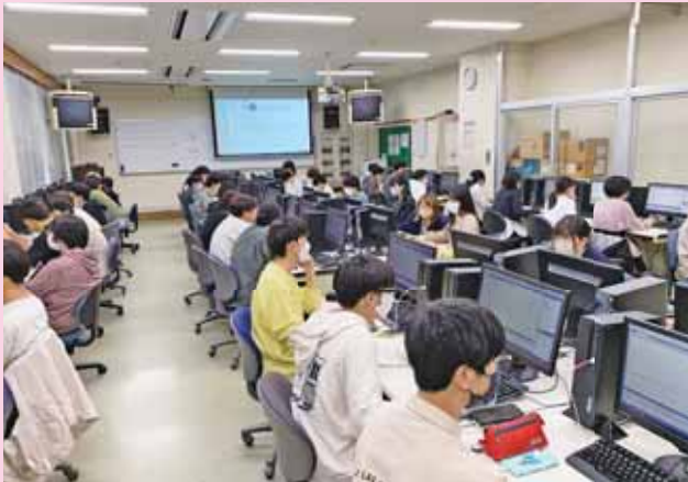
▲情報システム演習Ⅲ Information Systems Exercises III