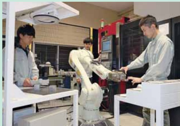
▲ロボット操作 Robot Operation

メカニクスとは物体の運動に関連した力学を意味します。このコースでは機械力学、材料力学、熱力学、水力学という機械工学のベースとなる4つの力学に関する知識や技術を学びながら、エレクトロニクスや情報通信技術（ICT）との統合が進む近年の幅広いものづくりに対応できる技術者の育成を目指しています。