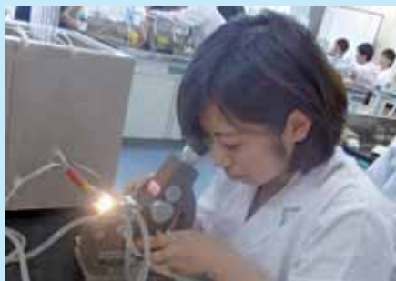
▲応用化学の実験の様子