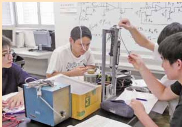
▲制御工学実験 Experiments in Control Engineering

世界人口の増加や生活水準の向上に伴うエネルギー消費の拡大は、資源・環境問題などを引き起こしており、これら諸問題への対応は人類の喫緊の課題となっています。特にエネルギー資源の確保・開発やエネルギーの効率的な利用は、持続可能な社会を築く上で重要な位置を占めています。