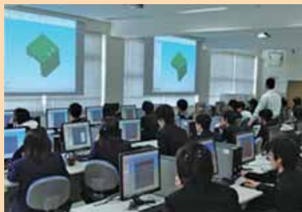
▲3DCAD演習 3DCAD Practice