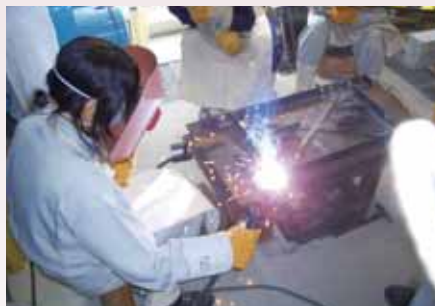
▲溶接実習 Welding Practice