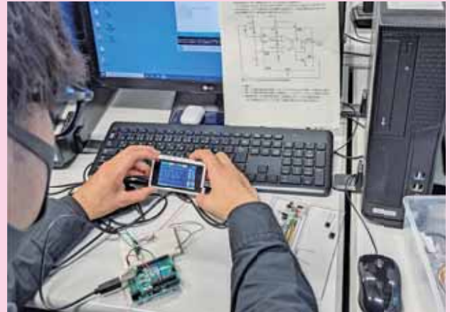
▲組み込みシステム実験 Embedded Systems Experiment

情報通信技術（ICT技術）を活用した情報システムは、生産、経済、医療、福祉、教育などのあらゆる分野で使われており社会基盤として不可欠なものになっています。情報システムコースでは、(1)コンピュータのソフトウェア及びハードウェア、情報ネットワーク、組み込みシステムなど情報システムに関する基礎学力及び基礎技術力をもつ技術者、(2)情報システムの構築を通して人々の生活の質（QOL）の向上に貢献できる実践的技術者、(3)情報システムとその周辺分野の知識を身につけ社会ニーズに柔軟に対応できる技術者の育成を図ります。