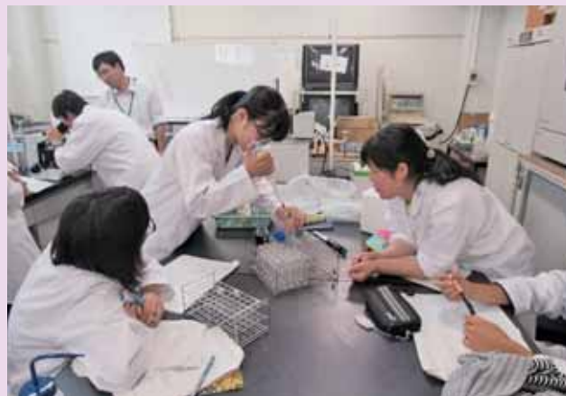
▲生命科学の実験の様子 Experiments of Life Science

バイオテクノロジーは生物が有する機能や情報を基に工学的に応用した技術です。近年、地球環境保全、新規医療、食品生産など様々な分野において人々の生活向上を目指す上で、バイオテクノロジーへの期待が高まっています。