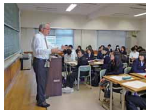
▲ 1年生に対する進路セミナー Career Seminar for 1st Year Students

The Career Support Office (CSO) was established in order to make plans and promote activities to help the students choose a better future career. Our activities are expected to contribute to forming their views of careers, something that will be useful to them not only on graduation, but even at later stages of life. As the initial event, career seminars are planned.