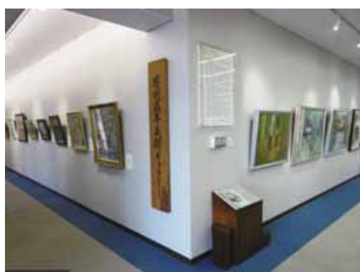
▲美術ギャラリー Art Gallery