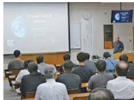
▲特別講演「あなたが作る未来～シリコンバレーが作っている未来～」 Special Lecture

The Regional Collaboration Center was founded for the purpose of activating the community through our college's active collaboration with local industries and local governments. It also aims to perform the functions of education, research, and development in basic technology for manufacturing products as well as holding consultations with small businesses in the areas concerning technological problems and conducting joint research. Moreover, this center plans and manages extension lectures for local children and adults.