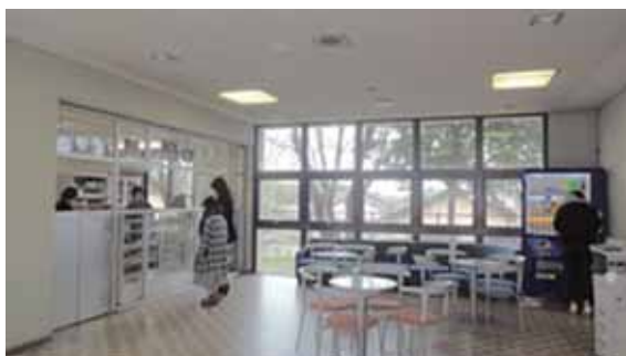
▲売 店 School Store

The Shuko-Kan was built in 1983 as welfare facility for students. The two-story building with a floor space of 888 m 2 includes a cafeteria, a health room, a counseling room, and a school store on the first floor. It also houses various students, service rooms on the second floor; a music room, and a room for the student council.