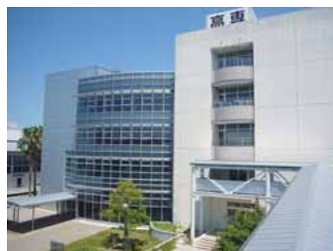
▲総合研究棟（左）と電子情報工学科棟 General Research Building(left), Electronics and Information Engineering Faculty Building

There are lounges at the connections with the Electronics and Information Engineering Faculty Building. The lounge, a common facility provided with a mini-kitchen, offers a space for the students to relax at recess. The frames are equipped with low yield strength steel dampers for seismic response control and the 3rd and 4th floors have a suspension structure. Moreover, an underground cold heat storage system and photovoltaic power generation system installed on the building serve as supplementary energy sources for the room air conditioners.