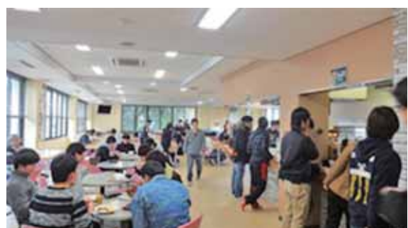
▲食 堂 Cafeteria