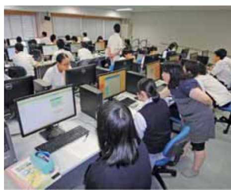
▲低学年の情報リテラシーの授業 Class of Information Literacy for the Lower Grades