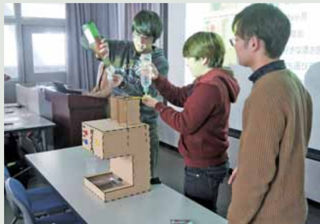
▲創造設計合同演習（商品の改善提案と製作）

Advanced Experiments Combination (with Interns from Thailand)