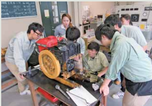
▲合同特別実験（エンジンの分解組立、タイからのインターンシップ学生も参加中）

Advanced Experiments Combination (with Interns from Thailand)