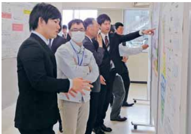
▲ 特別研究発表会（ポスターセッション） Research Presentation

In the selection by academic achievement test, we select students who have the necessary background, basic academic skills, and basic knowledge of their specialty to study this major course. The selection by academic achievement will be based on a comprehensive review of the applicant's academic achievement test results, the research report submitted by the principal of the applicant's home (enrolled) school, and the application form. The academic achievement test is a written test consisting of English (equivalent to TOEIC), mathematics, and specialized subjects. Basic knowledge of specialized and interdisciplinary fields will be comprehensively evaluated through a research paper and a written examination of specialized subjects, the ability to play an active role in international society will be evaluated through a written examination of English and mathematics, a research paper and an application form, and independence, practical ability, and motivation for social development will be evaluated through an application form.