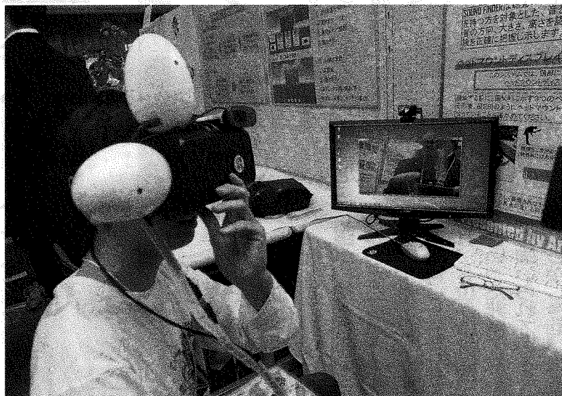
「SOUND FINDER」のデモンストレーション

から国際大会と同時開催になるなど、大会の規模も大きくなってきました。有明高専からの最近の本選参加チームは、視覚的に音を見つけるシステム「SOUND FINDER」